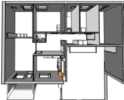
F56 3D näkymä