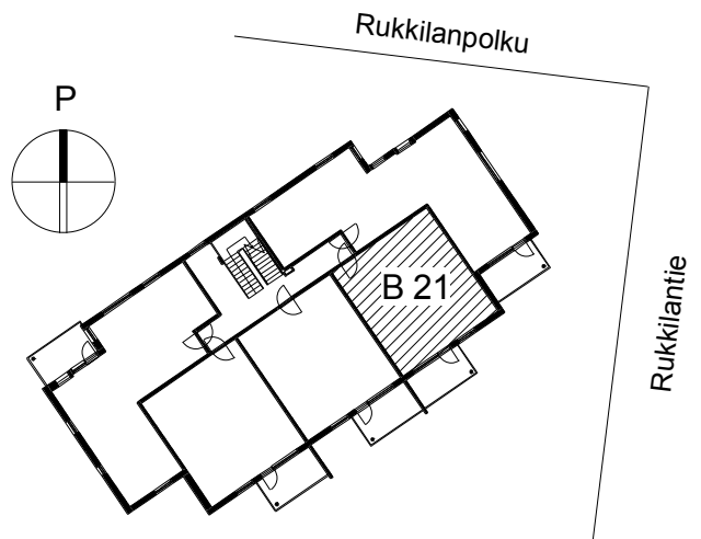
B 21 Sijainti